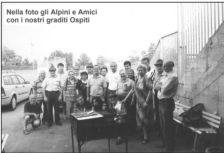
Nella foto gli Alpini e Amici con i nostri graditi Ospiti